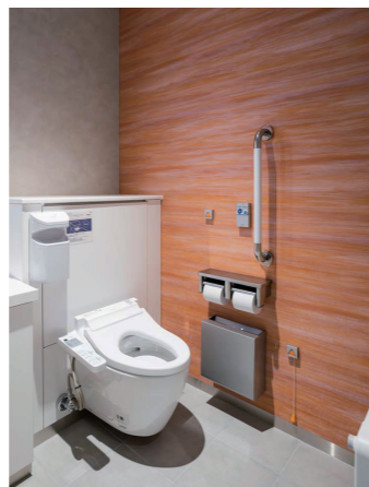
個室完結型トイレ

内装は「BLUE」「YELLOW」「RED・ORANGE」「BROWN」「PURPLE」といった自然をモチーフにした5色のデザインを展開し、多彩な色使いによる個性豊かな空間を提供。好みの個室を選べるよう工夫されている。