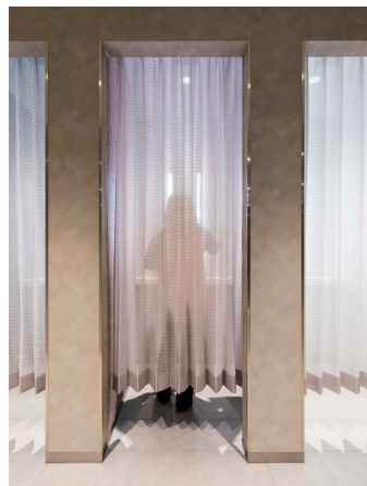
パウダーコーナー

壁掛大便器セット・フラッシュタンク式:UAXC3CS1/ウォッシュレットP:TCF589AUY 台付自動水栓:TLE24008J、TLE28002J/自動水石けん供給栓:TLK07S系 クリーンドライ（ハンドドライヤー）:TYC320W/LED照明付鏡:EL80013、EL80016 フラットカウンター・バリアフリートイレバック:XPDA系/パブリック用手すり:T114C6R 収納式多目的シート:EWC520AR系/フィッティングボード:YKA41R