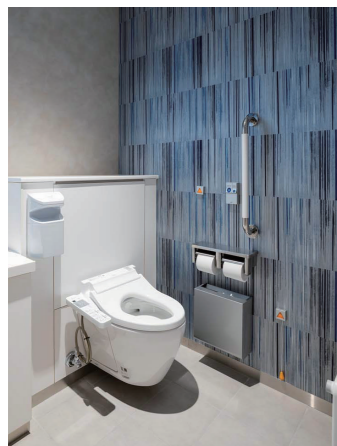
個室完結型トイレ

トイレ専用通路に満空表示のパネルを設置し、個室まで行かずとも空き状況を確認可能。さらに、使用中は個室のランプも点灯。各個室異なる空間デザインが把握できるように、入口サインも呼応したデザインを施している。